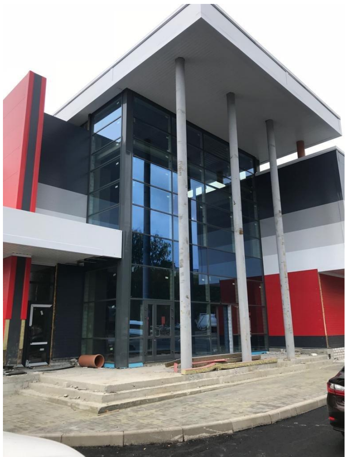
Магазин «Пятерочка» г. Брянск